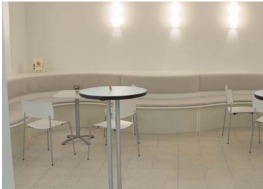
Blick ins Foyer, das bei Pausen und Kaffee freundlich einlädt.