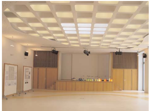
Der große Saal