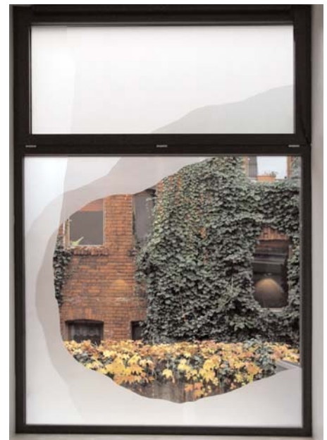
Blick aus einem Fenster im großen Saal

Kaffee, Tee, Milch, Zucker werden gestellt