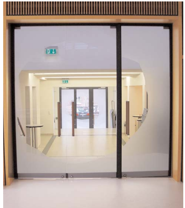
Blick aus dem Großen Saal durch das Foyer

Das künstlerisch gestaltete Gemeindehaus empfängt bei Tagungen, Ausstellungen und Konzerten die Besucherinnen und Besucher mit Licht und großer Liebe im Detail. Die moderne Ausstattung trägt dazu bei, dass man gerne hierher kommt.