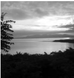
Managua-See im Morgengrauen

Am Ende der Konfirmandenzeit stellen die Konfirmanden sich einer Herausforderung: sie bereiten gemeinsam einen Gottesdienst vor. Jede und jeder bekommt im Gottesdienst eine Aufgabe, sei es die Gestaltung eines Gebets oder eines Teils der Predigt. Das Thema des Gottesdienstes wird gemeinsam besprochen. Die Beiträge für den Gottesdienst erarbeiten die Jugendlichen selbst. Am 5. April folgt dann das große Fest der Konfirmation.