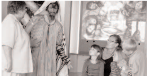
Besuch im Bibel-Erlebnis-Haus

Am 31.10.09 trafen sich die Kindersonntagskinder hoch oben auf dem Kirchturm und begaben sich auf die Spuren Martin Luthers. Mit Hilfe seiner Frau Katharina gab es in seinem Lebenslauf viel zu entdecken und der Kirchturm wurde auch von den Kleinsten (3 Jahre) erklommen. Zur Stärkung und zum Abschluss des Reformationsfestes gab es noch Luthersuppe und Lutherbonbons im Keller des Gemeindehauses, wo die Kinder auch die Möglichkeit hatten, ihre eigenen „Thesen“ anzuschlagen (diese können im Gemeindehaus angesehen werden).